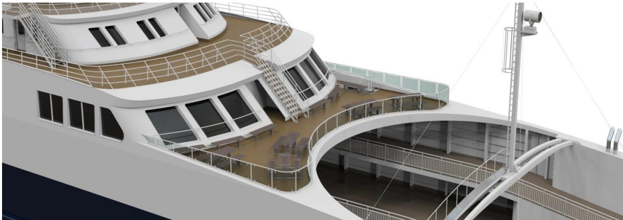
Glasskledd soldekk med sitteplasser og panoramavinduer i passasjersalng.

I hver ende av salongen er det utgang til soldekk.